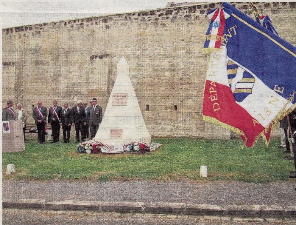
Les morts de la bataille de Montécouvé ne tomberont pas dans l'oubli.

JUVIGNY Un monument en mémoire de la bataille de l'Orme de Montécouvé en août 1918 vient d'être érigé, plus de 100 ans après les faits.