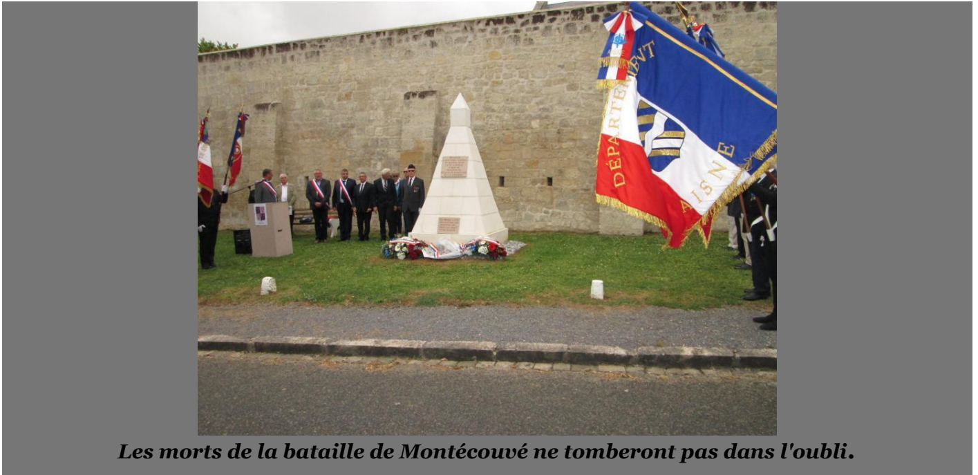
Les morts de la bataille de Montécouvé ne tomberont pas dans l'oubli.

Juvigny Un monument en mémoire à la bataille de l'Orme de Montécouvé en août 1918 vient d'être érigé, plus de 100 ans après les faits.