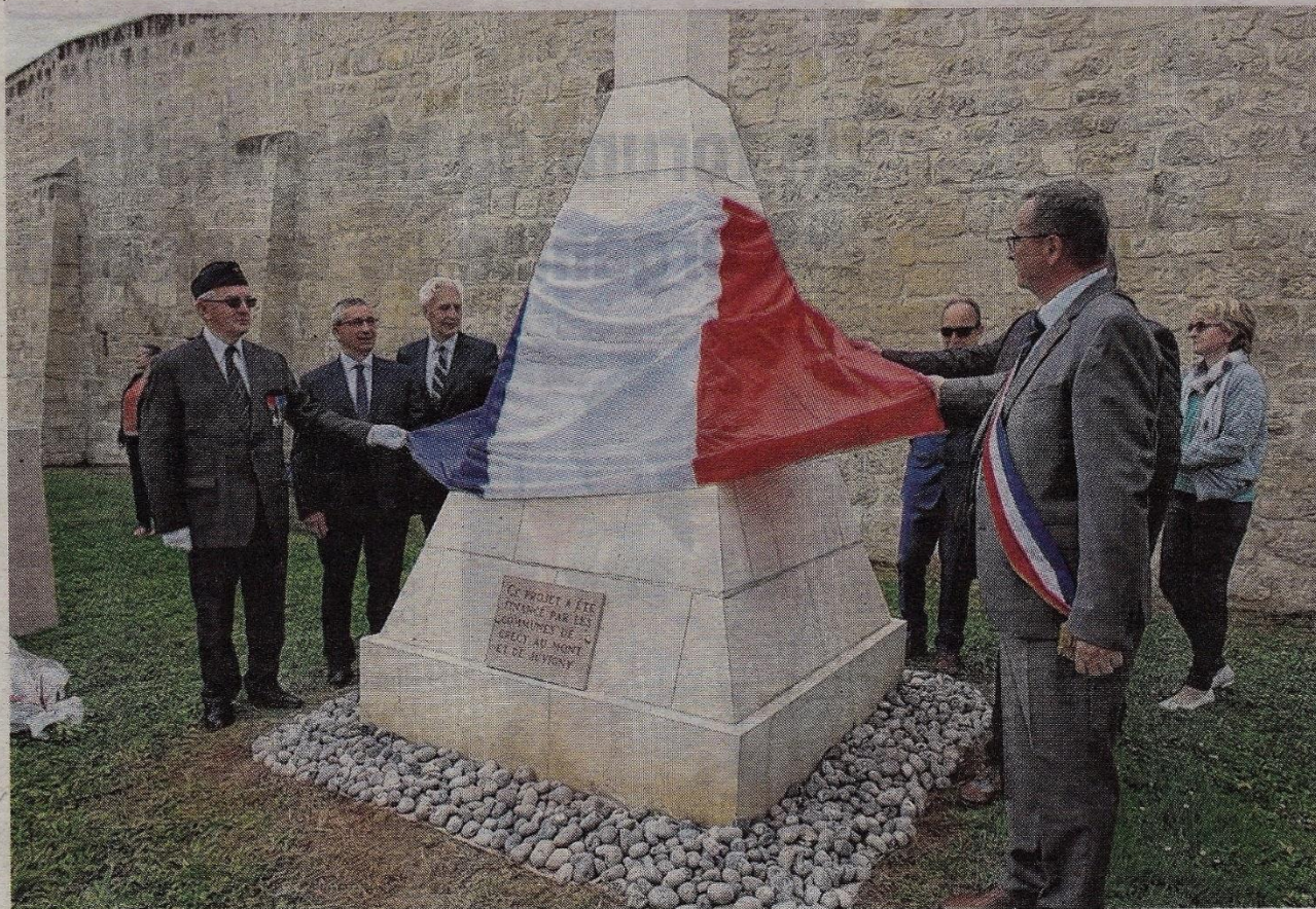
Un premier monument en forme de pyramide avait été érigé entre le 29 août et le 2 septembre 1918 au sommet de la colline de Montécouvé.