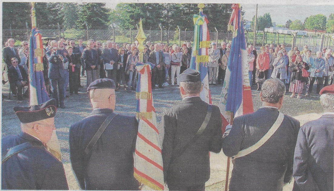
Vingt et un porte-drapeaux et deux cents personnes ont participé à la cérémonie, hier matin.

Il y a cent ans jour pour jour, le 4 octobre 1915, le chef du 4 e bureau du sous-secrétariat d'État de l'aéronautique militaire écrit au général commandant en chef: « J'ai l'honneur de vous faire connaître qu'une école d'aviation militaire va être créée incessamment à Châteauroux. Cette école commencera à fonctionner le 25 octobre. »