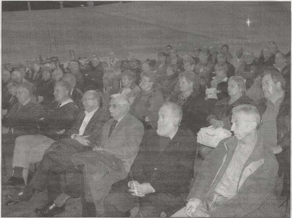
Une centaine d'adhérents était présente le 17 janvier dernier lors de l'assemblée générale.

Lors d'une assemblée générale extraordinaire le 17 janvier, les adhérents de l'asso-