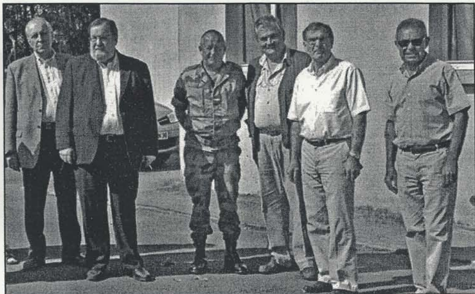
La délégation de la fédération était en septembre à la Martinerie pour rencontrer les élus.