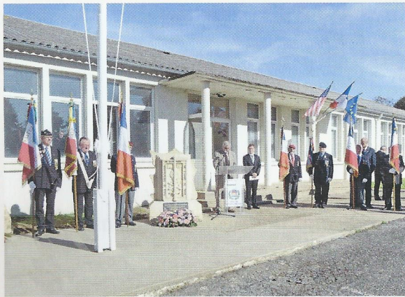
Le lieu de mémoire de la présence militaire dans l'Indre accueille déjà des visiteurs, alors que son aménagement va bon train.