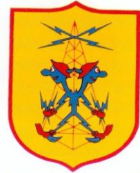
8th RADIO RELAY SQUADRON (Approved 1954)