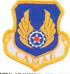
CENTRAL AIR MATERIAL AREA, EUROPE