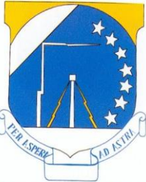
7th RADIO RELAY SQUADRON (Approved 1955)