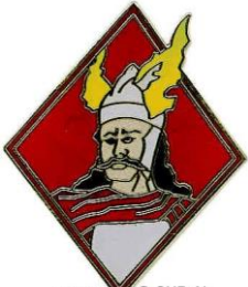
A 1229 @ SHD Air