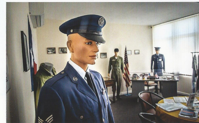
Les Américains à Châteauroux-Déols > 1951 - 1967

Les travaux ont débuté en 2015 avec le soutien financier de notre député, du Conseil Départemental de l'Indre, de La Fondation Banque Populaire Val de France (pour la salle des drapeaux), de Châteauroux Métropole, d'une douzaine d'entreprises locales qui nous offrent des matériels et matériaux utilisés par nos bénévoles (plus de 7 000 h de bénévolats à ce jour) pour la mise aux normes et l'aménagement visuel et audio-visuel des 700 m2 du bâtiment et des 7 000 m2 de terrain destinés à devenir ce lieu de mémoire.